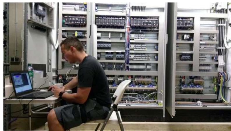
Ein Hallenbad besteht nicht nur aus Wasser, sondern auch aus jeder Menge Technik. Hier bereitet ein Programmierer die Steuerzentrale vor.