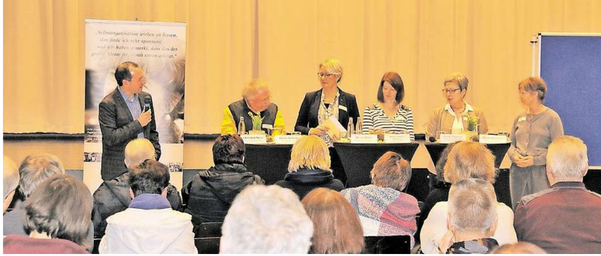
Die Teilnehmer und Einladenden trafen sich in der Aula der Städtischen Realschule Geilenkirchen.

Projekte für das Leben im Ruhestand - Neue Netzwerkgründung